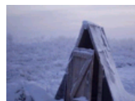
最冷的人类居住地