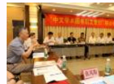
“中文学术图书引文索引” 研讨会在南大举行