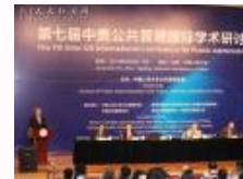
第七届中美公共管理国际学 术研讨会在人民大学召