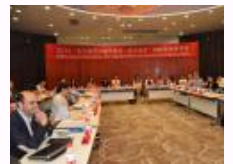
“重访城市”国际研讨会在 上海交大举行