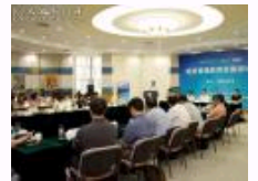
信用管理教育发展研讨会在 人大举行 发布《信用