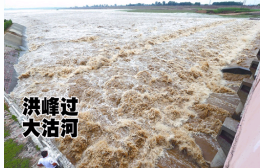
大沽河泄洪如壶口瀑布场..