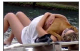
爆笑!逆天妹子欢乐多