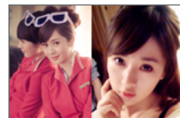
大陆最美空姐海量私照