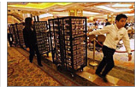
全方位揭秘澳门赌场