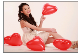
女人惹人怜爱的7准则