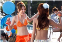
童颜巨乳的宅男女神