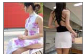
征服美少女美女出没地