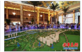
十里金滩示范区开放