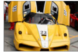
出租车租金最贵1天9万