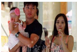
李小璐逛街吃冰棒 贾乃亮..