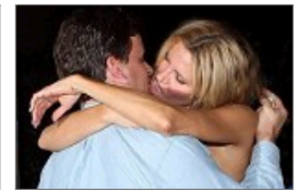
布兰迪狼吻男性友人