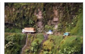
全球公认第一夺命公路