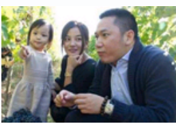
赵薇爆肥被疑怀二胎!