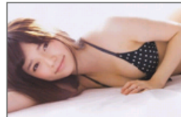
萌妹子也有性感的一面