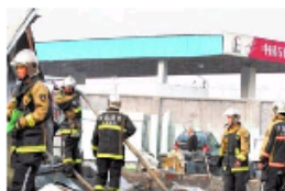
工厂着火“吓瘫”邻居加油站