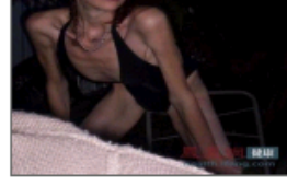
瘦到恐怖的厌食症患者