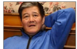
图揭赵本山超奢华生活