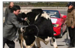
车主雇奶牛拉宝马维权