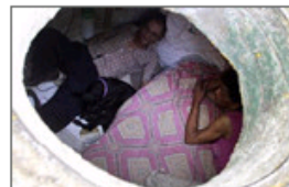
老夫妻下水井生活22年