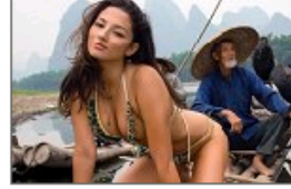
美模泳装桂林写真