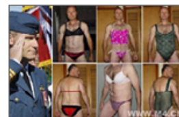
全球色魔罪行令人发指