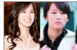
女星嫁豪门前凄惨境况