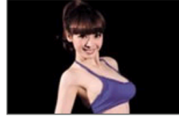
美女明星都爱秀“体操”