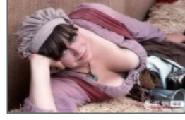
小镇上的丰乳肥臀