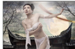
金瓶梅堪称情色甄嬛传