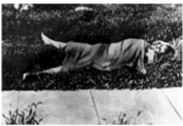
传奇女星死亡之谜