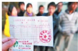
80名大学生放假包车被骗