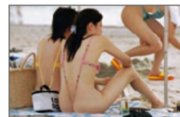
搞怪美女雷死人不停命