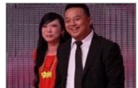
曝非诚女嘉宾砍死丈夫