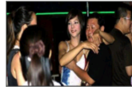
去泰国旅行的N个理由