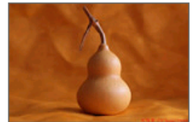
必看2013旺运风水布局