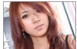
盘点“非诚勿扰”极品女嘉宾