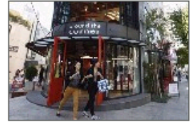
解密真正的韩国富人区