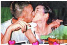
曝明星当街浪荡行为