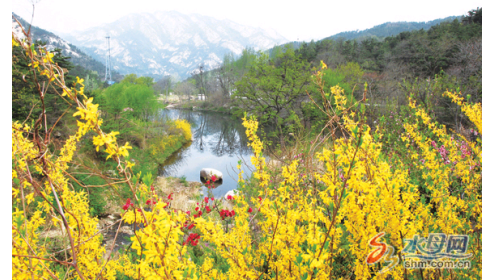
烟台百花齐放赏花正当时