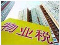
房地产消费税并非物业税