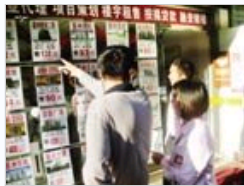
现在是卖房的好时机