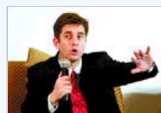
胡润:重庆隐形富豪很多