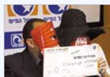
以色列夫妇蒙面领巨奖