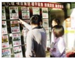
现在是卖房的好时机