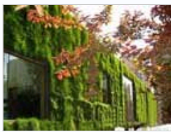
低碳住宅是黑色阴谋