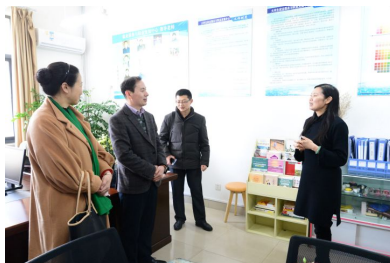
学生就业指导与职业生涯规划