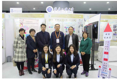
我院学子在“挑战杯”国赛中荣获佳绩(1)