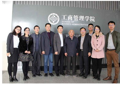
我院与大连理工大学管理与经济学部共同举办“工大一工大”博士绿色发展论坛