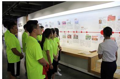
学生暑期企业实践活动