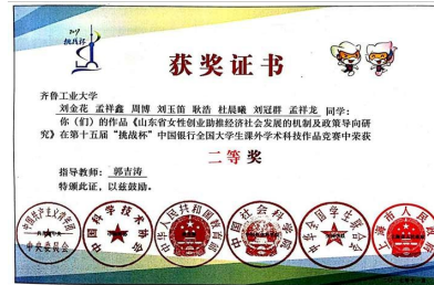
我院学子在“挑战杯”国赛中荣获佳绩(2)