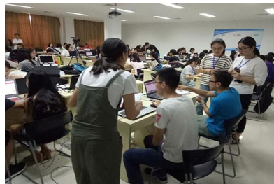
学生在实习实训基地