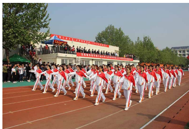
学院连续多年获得校运动会精神文明奖第一名、学生组运动成绩前二名