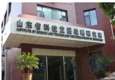
山东省科技发展战略研究所