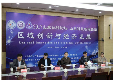
我院承办2017山东社论坛、山东科技智库论坛