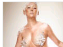
群星赤裸拍慈善大片