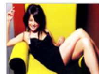
房产富豪的明星小蜜