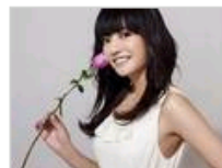
明星最新广告收入曝光