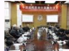
《中国近代思想家文库》新书发布会暨编委座谈会