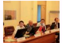
《胡华文集》出版发行 推动党史研究与教学