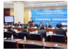
厦门大学在京发布中国宏观经济预测报告