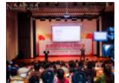
2014全球营销领袖北京论坛在人民大学举办 探讨