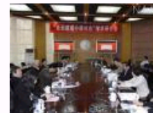
“全面建成小康社会”学术研讨会在人民大学召开