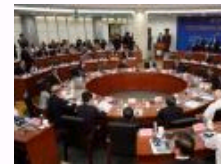
“2014南洋论坛”在厦门大学召开