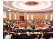
首届“中国传播能力建设”创新与发展学术研讨会