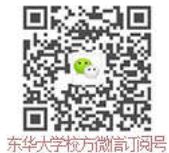
东华大学校方订阅号