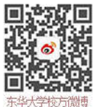
东华大学官方微博