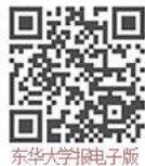
东华大学报电子版