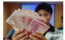
北京鼓励见义勇为 牺牲者最高可奖35万