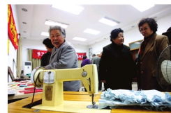
百余老物件儿居委会内集体“显摆”(图)