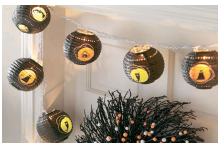
万圣节的搞怪家居(组图)