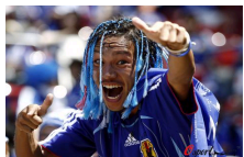
图片特集:超奇发型,你敢剪吗?