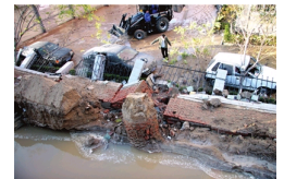
水管爆裂冲垮围墙砸坏车 与地下施工有关