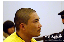
北京男子冒充广电总局局长 秘书抢劫电视台女主持