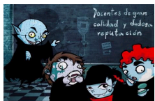
这样的学校你敢去上吗?