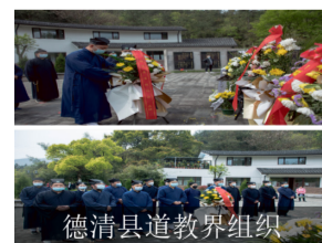
德清县道教界组织