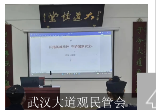
武汉大道观民管会