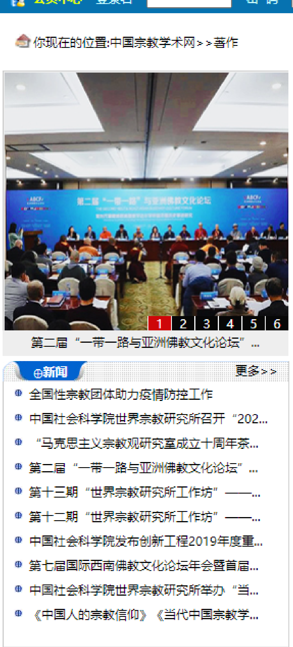
第二届“一带一路与亚洲佛教文化论坛”