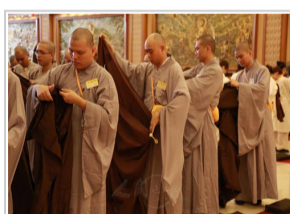
马来西亚短期出家修道