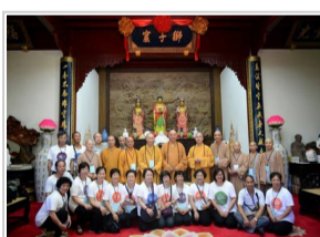
台湾新北市佛教会理事