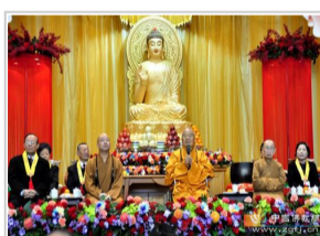
星云大师：百万人兴学