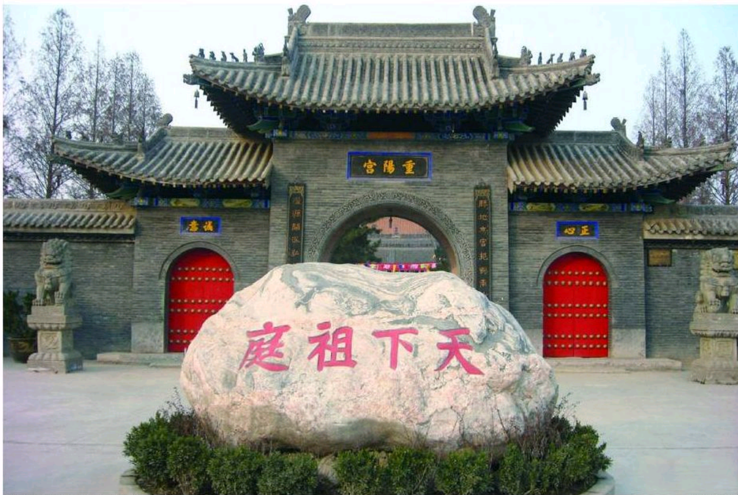
■位于陕西户县的全真教三大祖庭之一——重阳宫

【核心提示】 近三十多年来,国内外道教研究的成果众多,涉及的领域宽广,其中有一个值得注意的现象是道教研究从文献学向史学的转变。