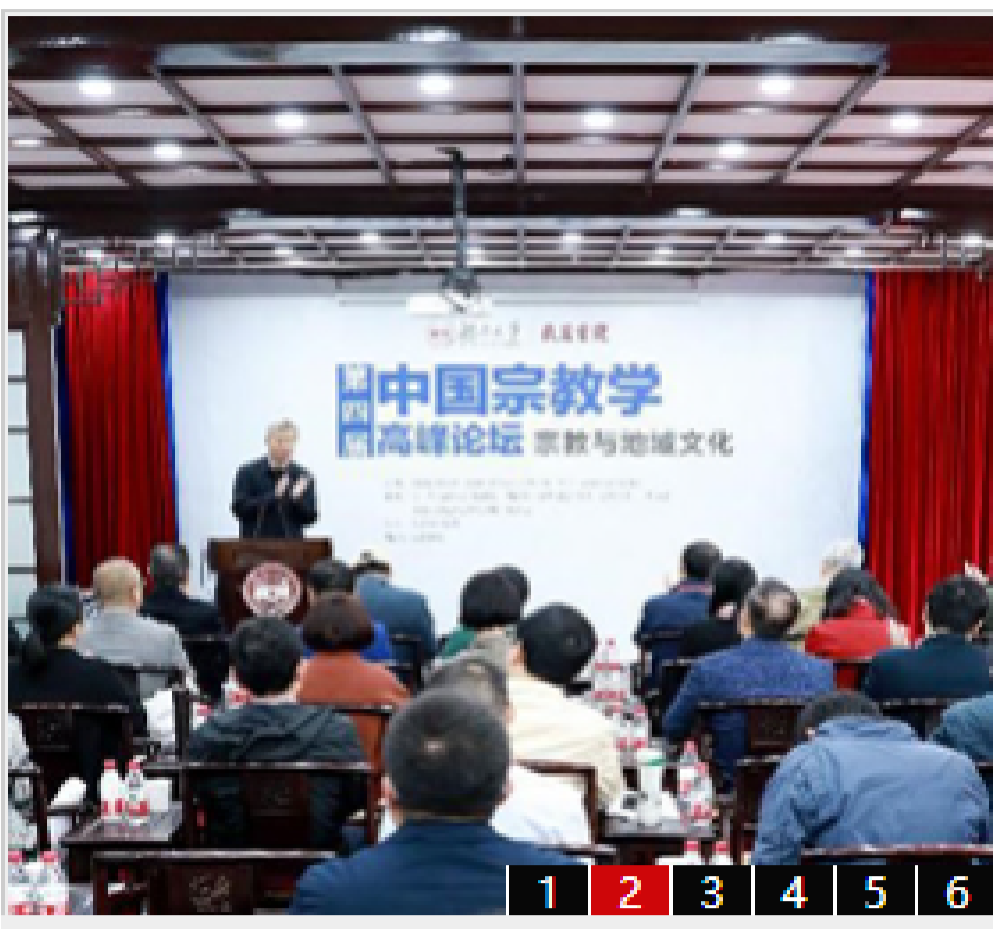
“第四届中国宗教学术高峰论坛”在湖南大...