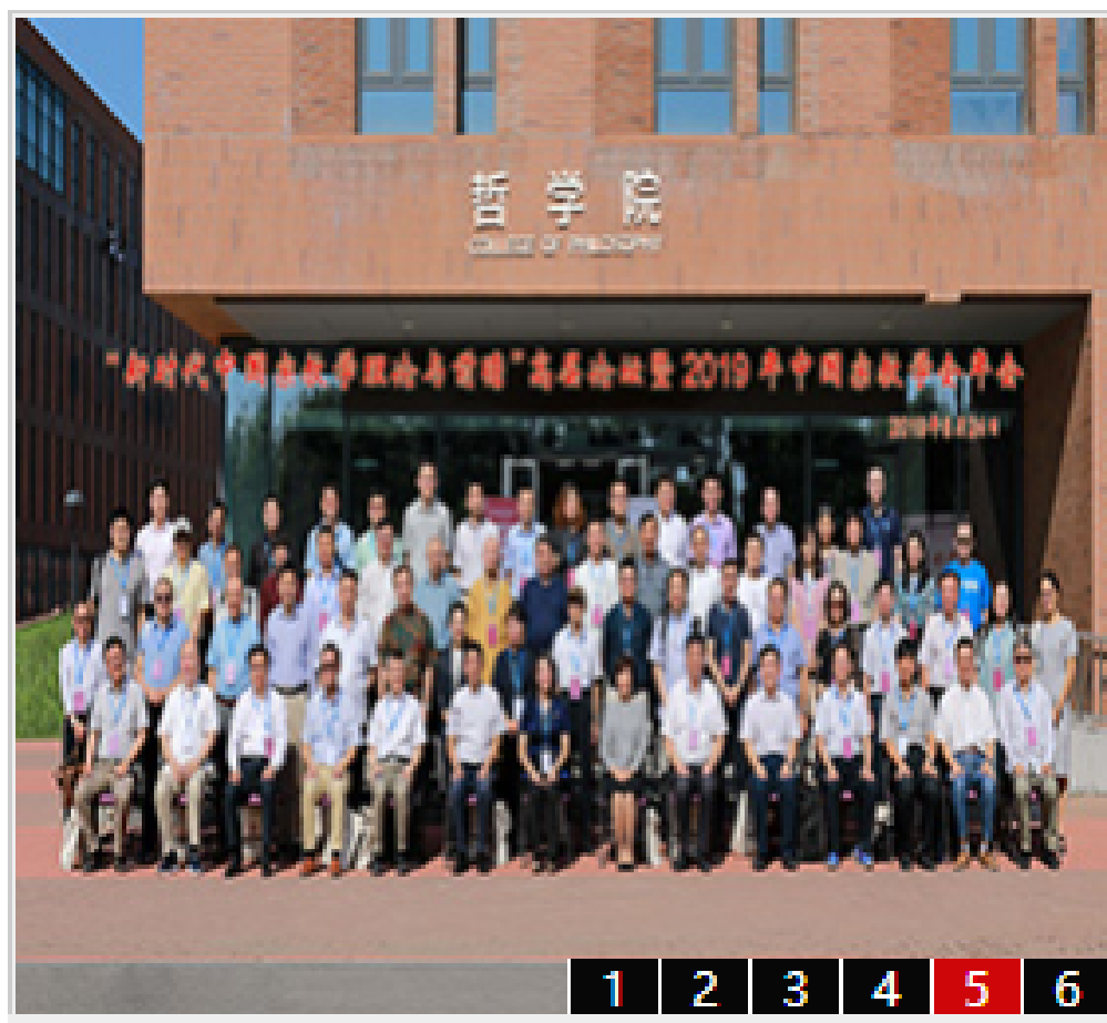
“新时代中国宗教学理论与前瞻”高层论...