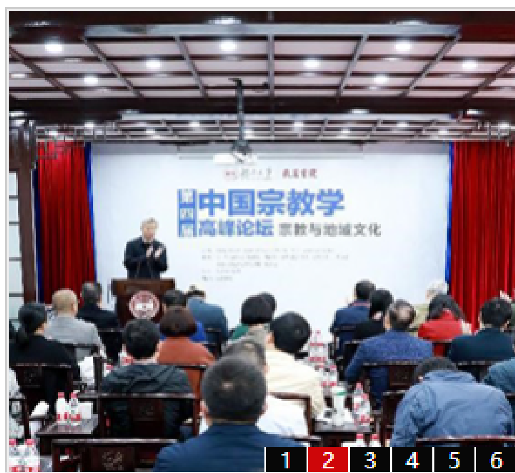
“第四届中国宗教学高峰论坛”在湖南大...