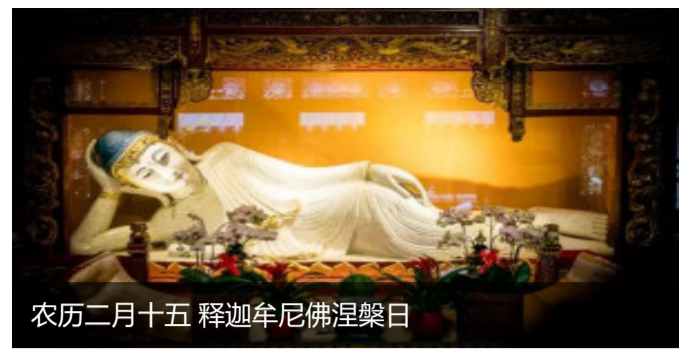
农历二月十五 释迦牟尼佛涅槃日