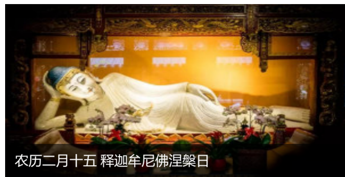
农历二月十五 释迦牟尼佛涅槃日