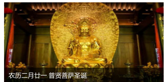
农历二月廿一 普贤菩萨圣诞