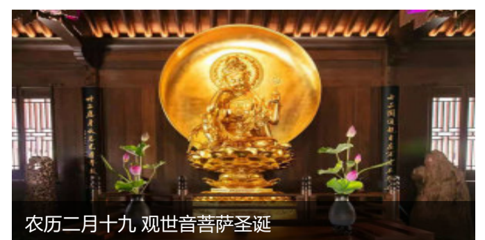
农历二月十九 观世音菩萨圣诞