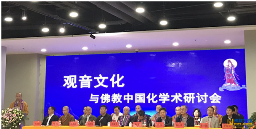
河北永年“观音文化与佛教中国化”学术研讨会