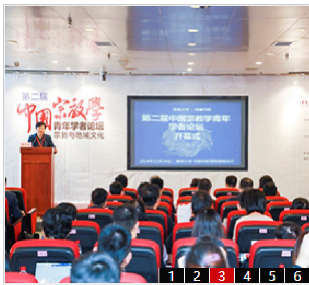
“第二届中国宗教学青年学者论坛”在湖...