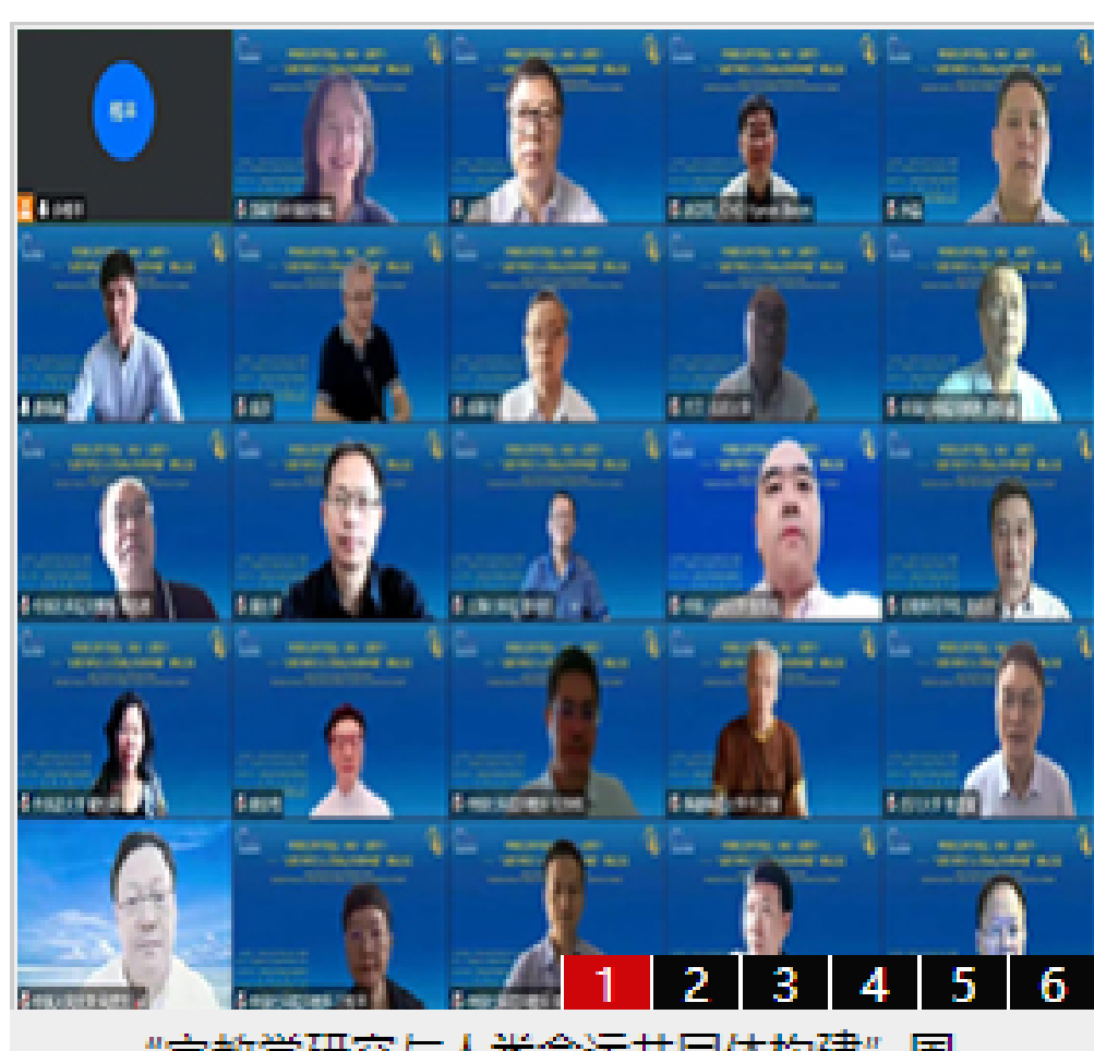
“宗教学研究与人命运共同构建”国...