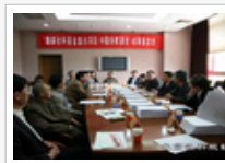
《中国诗歌通史》鉴定 湖南社科基金项目会议