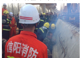
中铁河南信阳工地坍塌