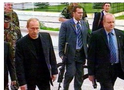
各国元首贴身保镖谁更牛