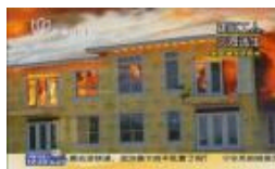
美工人因火灾被困顶层惊险求生