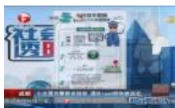
小伙充警察发短信 遗失ipad很快被送还