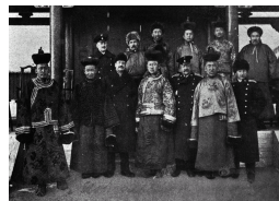
从民国手中丢掉的外蒙