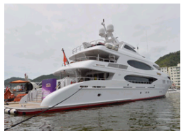
揭秘价值3亿豪华游艇