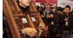
令人深思的当代浮世绘