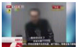
监控：孩子游乐园碰撞 家长发飙打人拉不住