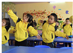
应对雾霾幼童室内运动