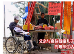
父亲与截瘫儿子的生活