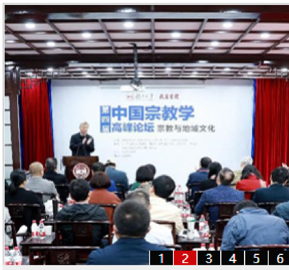
“第四届中国宗教学高峰论坛”在湖南大...