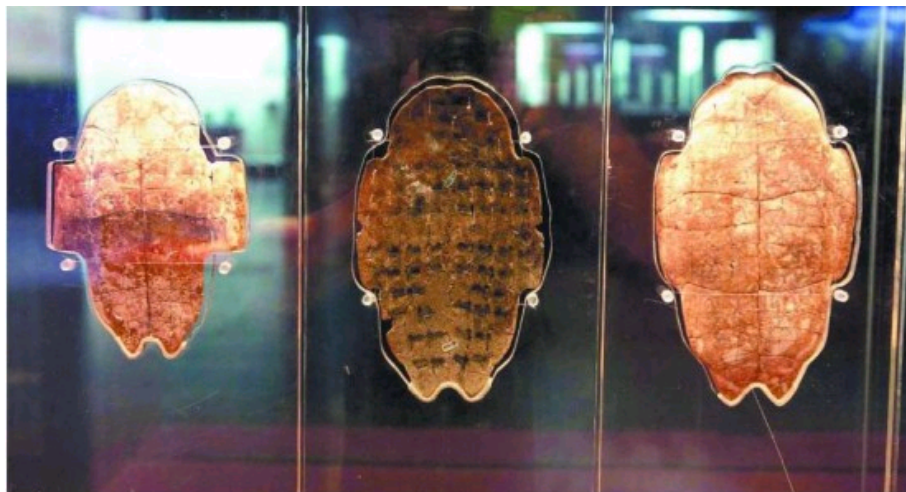
■河南安阳殷墟地窖内的珍贵甲骨片