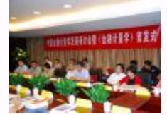
中国金融计量学发展研讨会暨《金融计量学》首发