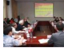
纪念《实践是检验真理的唯一标准》发表35周年座