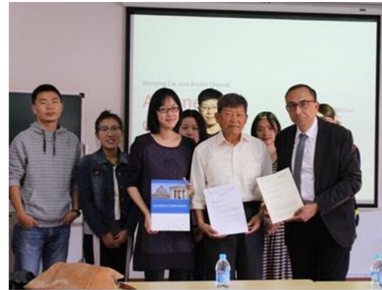
哲学系与巴黎一大哲学系签署合作协议