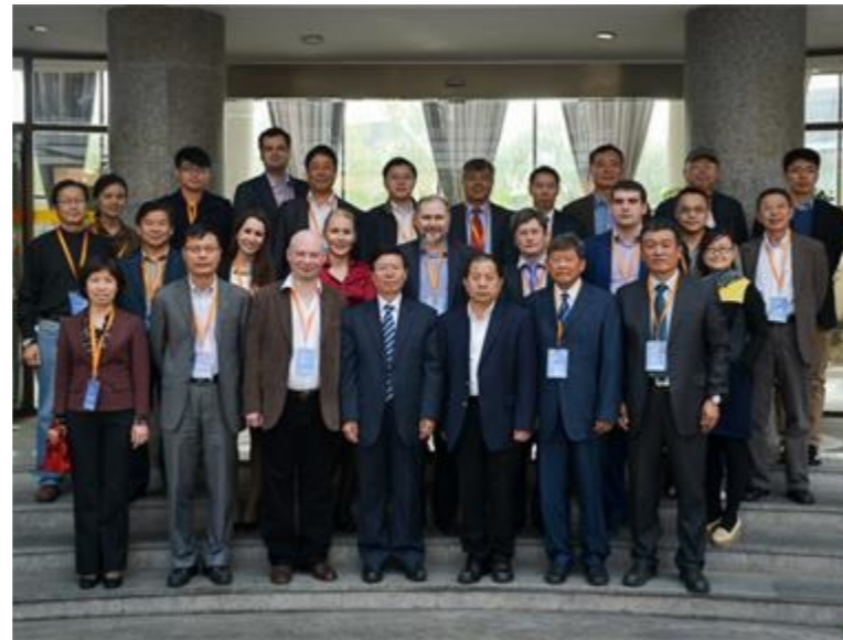
第十二届中俄经济社会发展比较论坛