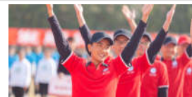
2018年华东师大运动会：美好未来更...