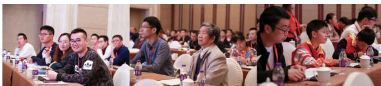
与会人员认真聆听

北京大学人文讲席教授陈鼓应在书面致辞中表示，诸子百家争鸣体现对话的时代意义，孔子、老子打开了人本思想、人道主义、人文情怀，把中国带向一个古代文明的高潮。孔子、老子都不是那样的单边主义，要反对儒学单一化的思考，尤其反对西方的单边主义。现代以来海峡两岸都有把儒学单一化的倾向，这不符合先秦精神。当代的诸子学发展，应该寻求先秦原有的学术样貌，让各家都能表达其意见。