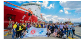
2018“感知中国·中国科考之旅”再...