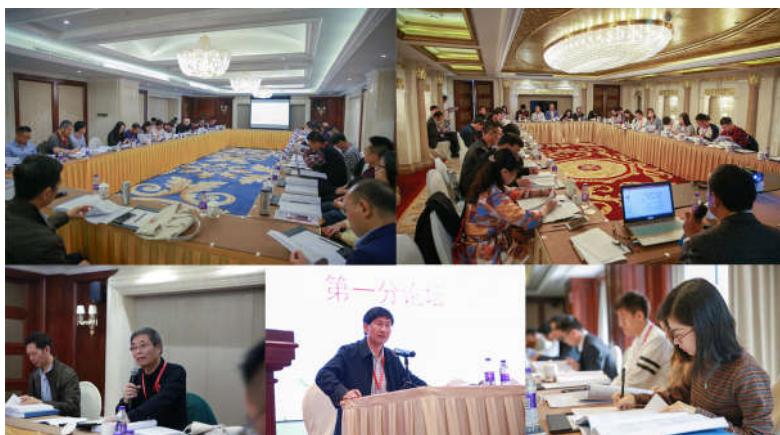
“首届诸子学博士论坛”分组论坛