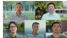
成为更好的大学，遇见更好的你