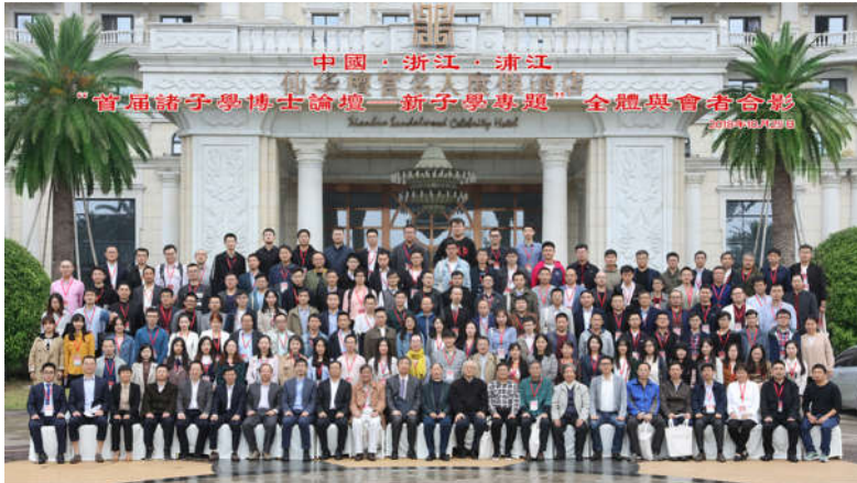
“首届诸子学博士论坛”

学、书画著名，又有“江南第一家”为代表的家族文化传统。此外，浦江和诸子学有很深的渊源，滥觞于方凤、发皇于宋濂的浦江诸子学，在我国诸子学发展历史上有重要的地位。在当代，华东师范大学先秦诸子研究中心方勇教授为方凤后裔，以发展和重构中华文化为己任，启动《子藏》工程，汇集培养诸子学人才，开拓诸子学研究领域，倡导“新子学”理念，其传承浦江、发展诸子学的关系明晰可见。浦江的诸子学，通过浦江籍学者的努力已蔚为大观，将引领中华民族传统文化新发展，并对当代思想产生积极影响。