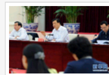
刘云山同培训班学员座谈