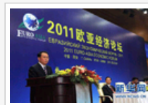
李长春出席欧亚经济论坛